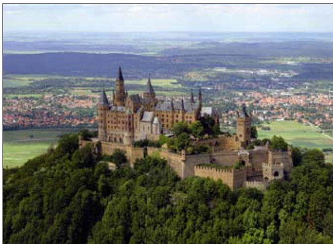
Burg Hohenzollern, Stammsitz des preußischen Königshauses und der Fürsten von Hohenzollern.

Mawlānā Shaykh Nāzīm geht es sehr gut. Er sagte: „Was Allāh der Allmächtige mich hier hat tragen lassen [der kürzlich schlechte Gesundheitszustand], ist eine spirituelle Last aus der muslimischen Welt, von seiten der Schwachen gewesen, die alle unter der Gewaltherrschaft von Unterdrückern sind. Das ist etwas Spirituelles, und aus Anlaß dieser spirituellen Krankheit ziehe ich mich eine Woche lang zurück. Und nun ist das Ende dieser Woche gekommen, und hiernach [wer-