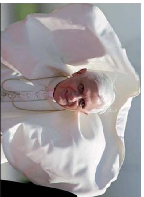
Papst Benedikt XVI.

Ich habe jenen Leuten gesagt, daß ich ihn gefragt habe: „Würden Sie gen heiraten?“ Und er hat mich angelächelt und gefragt: „Sind Sie glücklich zu heiraten?“