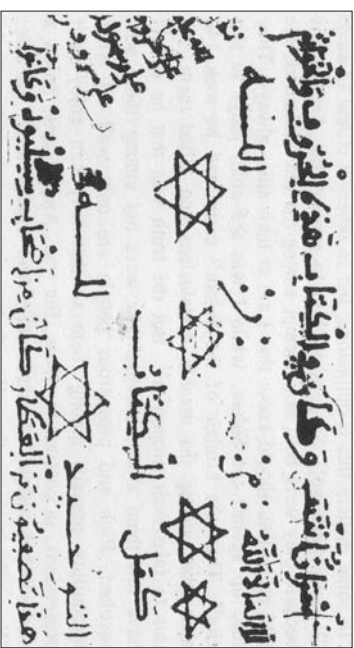
Diagramme dort S. 89, 259, 183