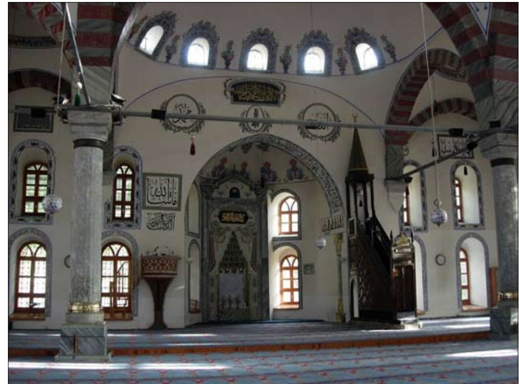
Die berühmte Ulu Moschee in Bursa, wo Süleyman Çelebi Imam war.

Wenn du das sagst, wird Allāh es dir leicht machen. Wenn du deine Arbeit mit Bismi llāhi r-raḥmāni r-raḥīm anfängst, wird sie einen glücklichen Ausgang nehmen.