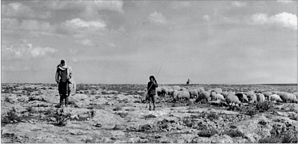
Aus der Photoserie der Schwedischen Expedition in Zypern 1927-31: Kythrea – Schafhirten in einer Ödlandschaft, im Hintergrund die Kapelle von Aghios Phokas.