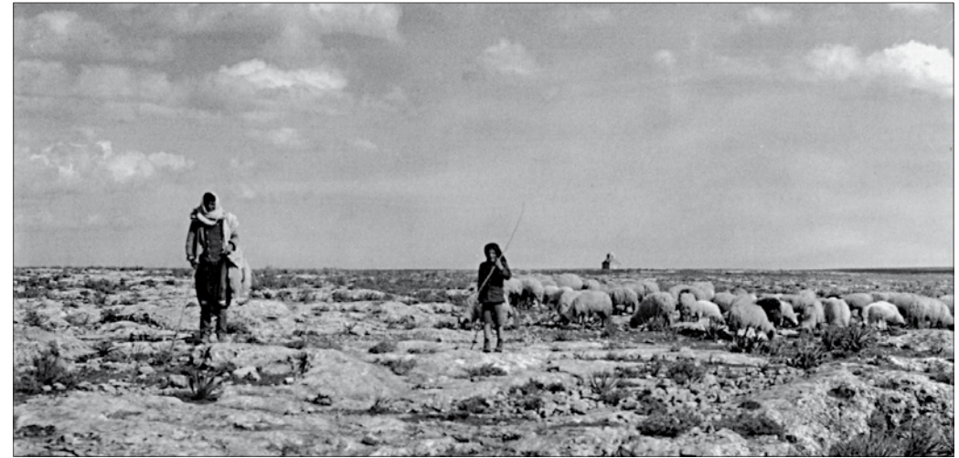
Aus der Photoserie der Schwedischen Expedition in Zypern 1927-31: Kythrea – Schafhirten in einer Ödlandschaft, im Hintergrund die Kapelle von Aghios Phokas.