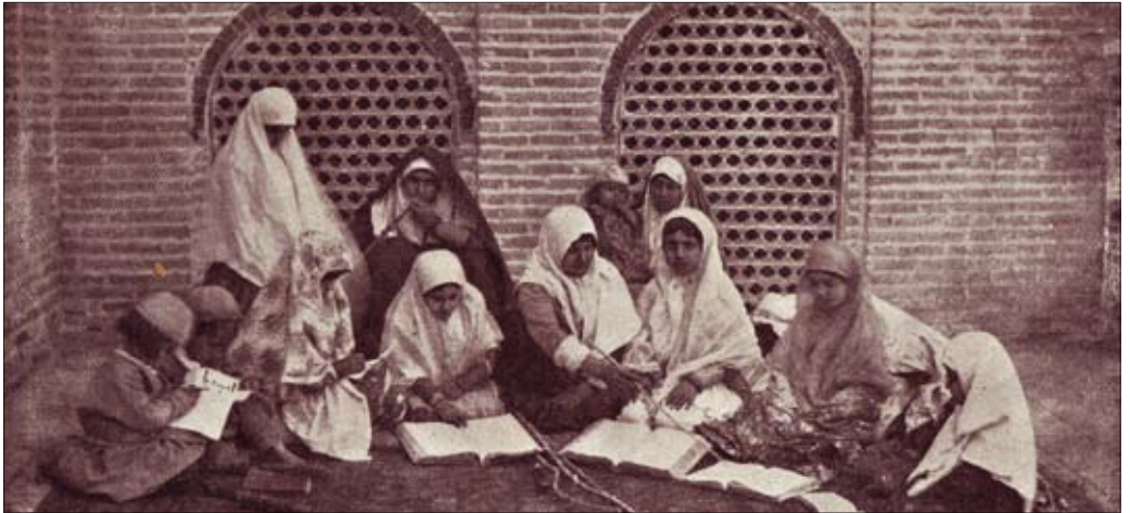
Mädchenschule in Täbris. W. Ph. Schulz, Welt des Islam , München 1917, Bd. I, S. 85.