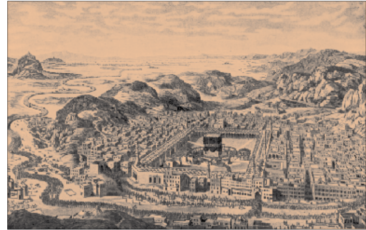
Kaaba 18. Jhd.

Das alljährliche Treffen findet am 5. Januar 2008 zum regulären Großen Dhikr Termin statt. Bei Terminänderungen werden wir euch kurzfristig per Newsletter und Homepage informieren.