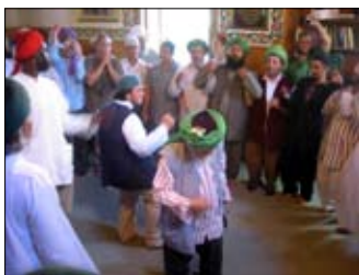
Hadra mit Scheich

„ Ad-dīnu naṣīhat “. Alle Religionen raten den Leuten: „O ihr Leute, seid rein! Geht nicht auf schmutzigem Land, weil ihr sonst schmutzig werdet!“ Alle Propheten sagen dies. Ihr Rat ist: „O ihr Leute, geht auf sauberem Land, dessen Reinheit euch erreicht.“ Das ist die Zusammenfassung des gesamten Prophetentums. Es ist eine Zusammenfassung, die Leute wach zu machen: „Wohin setze ich meinen Fuß?“ Ihr müßt das wissen!