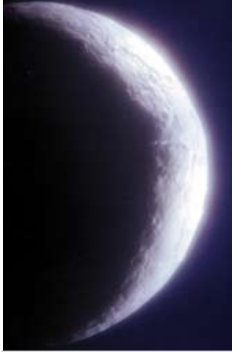
Astronomischer Neumond ist am Sonntag, 12. August, 23:03:35 Uhr.