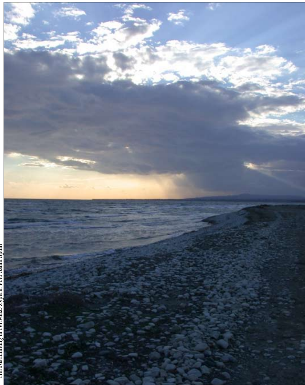
Herbststimmung in Perivolia/Zypern.

Eine Mücke – und dies ist himmlisches Wissen der Propheten, das bis zu uns reicht – hat einen Rüssel so wie ein Elefant auch. Sie ist eine fliegendes Geschöpf; sie fliegt und sucht die Menschen auf. Sie sitzt überall, aber da bleibt sie nicht; sie muß weiterhasten und herausfinden, wo die Kinder Adams sind! Die Mücke kommt auf sie! Und sie kommt nicht auf ihre Kleider, sondern auf ihre Haut. Und denkt ihr, daß dies einfach so kommt oder daß es einem Gesetz oder einem Herrscher unterliegt? Denn Allah der Allmächtige sagt: «... alladhī aʿtā kulla shayʾin khalqahu thumma hadā – Ich gebe ihnen ihre Existenz, ihre Form. Ich gewähre ihnen die Gründe, die Weisheit (für ihre Existenz), und dann schicke Ich sie, das zu tun, was