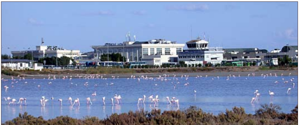
Sie sind wieder da: die Flamingos in Larnaka.