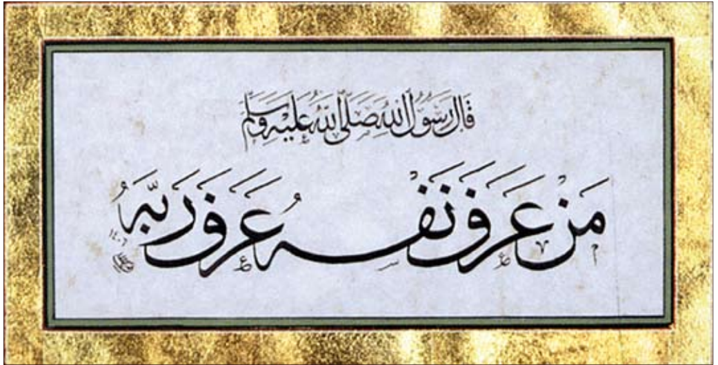
Kalligraphie Ismat Amiralai