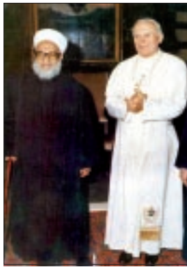
Ahmad Kuftaro bei einer Audienz in Rom