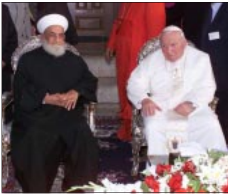
Ahmad Kuftaro, Großmufti von Syrien, empfängt den Papst in der Omayyaden-Moschee in Damaskus