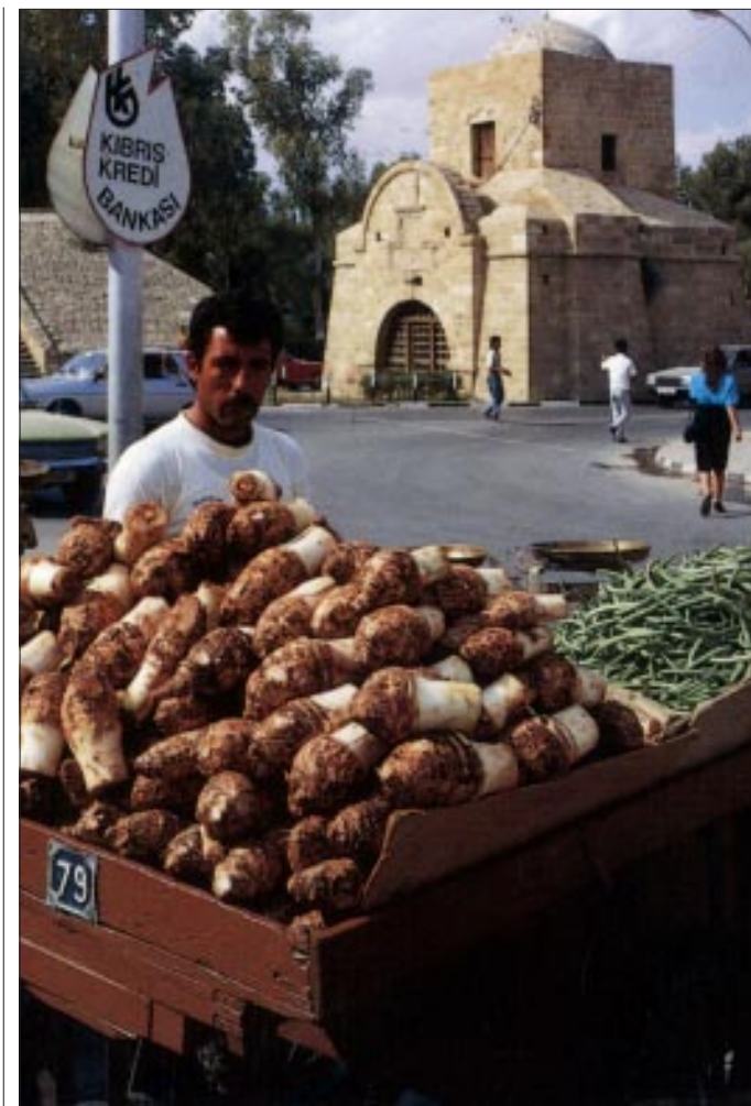
Markt in Lefkosa

* übersetzt von 'Abd al-Ḥafidh Wentzel. Quelle: www.naqschibandi.de