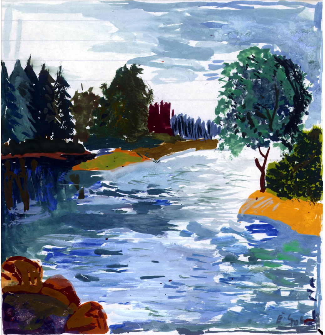
Aquarell Salim Spohr

kehrsregeln“ im Weltall sind so vollkommen! Die Schwerkraft keines Planeten könnte einen anderen in seiner Laufbahn halten, nein, jeder von ihnen gehorcht seinem Schöpfer, seinem „Programmierer“, Demjenigen, der ihn in Erscheinung treten ließ, Demjenigen, der seine Richtung bestimmt, seinem Meister. Sie alle unterstehen der absoluten Herrschaft des Einen, den niemand sehen kann! Doch Er sieht alle und alles, das Innere