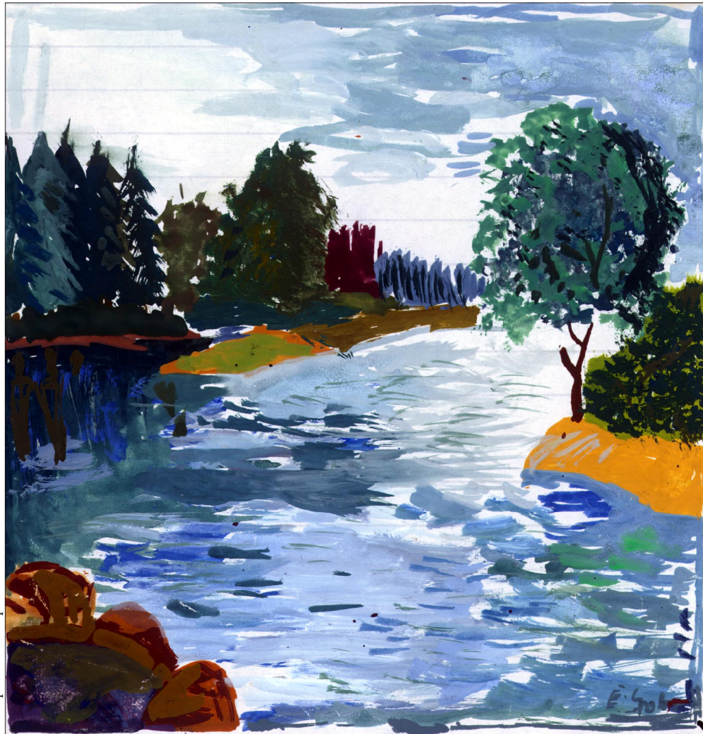
Aquarell Salim Spohr