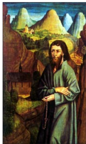
Nicklaus von der Flüh

Einmal traf ich in der Schweiz auf dem Weg nach Deutschland einen Priester bei der Kapelle des heiligen Nicklaus von der Flüh. Bruder Klaus war ein Gläubiger, der an Jesus Christus in der Weise glaubte, wie wir an ihn glauben, und nicht in der Weise, wie es die Christen tun. Sein Glaube war korrekt und vollkommen. Er lebte ständig für sich allein im Wald, und es verlangte ihn danach, nur für seinen Herrn zu sein. Solche, die danach verlangen, für ihren Herrn und den Dienst an ihrem Herrn zu leben, werden als Diener des Herrn akzeptiert werden, und in dem Maße, wie sie ihrem Herrn Dienerschaft erweisen, steigen sie auf zu Seiner Freundschaft, der Freundschaft Allahs des Allmächtigen. Sie werden zu Freunden Allahs; und die Freunde Allahs beginnen ihre