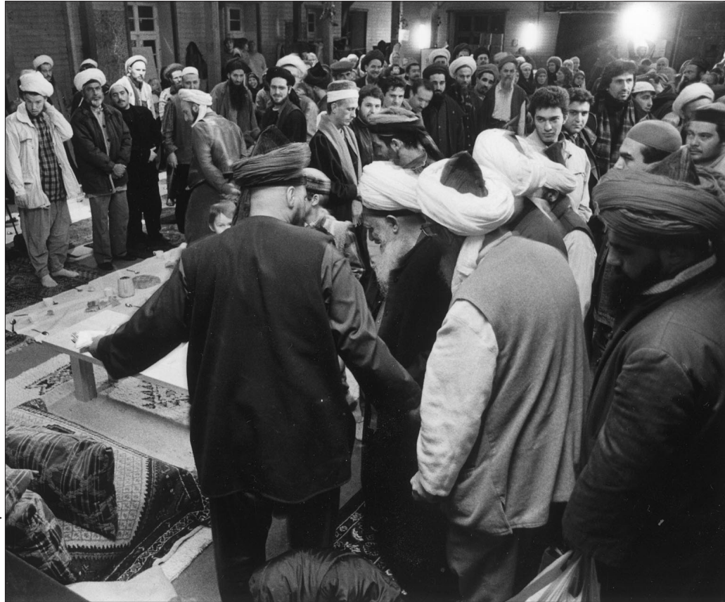
Sheikh Nāzīm Efendi bei einem Besuch der Osmanischen Herberge

In Erinnerung an die in früheren Zeiten jahrelang gepflegte Tradition der Treffen zum Jahreswechsel soll erstmals seit langem wieder in diesem Jahr zu Sylvester ein großes Naqschibandi -Treffen stattfinden.