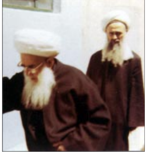
Großsheikh ‘Abdullāh ad-Daghīstānī und Sheikh Nāzīm Efendi betreten die Moschee Sheikh ‘Abdullāhs auf dem Jabal Qasiyīn in Damaskus, 1965.

„Der Sheikh wartete auf dem Dach des Hauses auf mich. Es lag hoch über der Stadt und bot einen erstklassigen Rundblick ... Ich fühlte mich von Anfang an wohl, und sehr bald erlebte ich ein großes Glück, das den Platz zu erfüllen schien. Ich wußte, daß ich in der Gegenwart eines wahrhaft guten Menschen war.