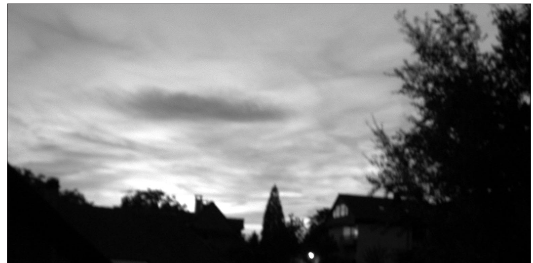
Um diese Zeit (nach maghrib ) gehören Kinder ins Haus – und Erwachsene ebenso.

Möge Allāh uns vergeben und euch segnen, und mögt ihr von Allāh dem Allmächtigen erbiten, daß wir nicht zu jenen Leuten gezählt werden, die gegen Salām sind und die versuchen,