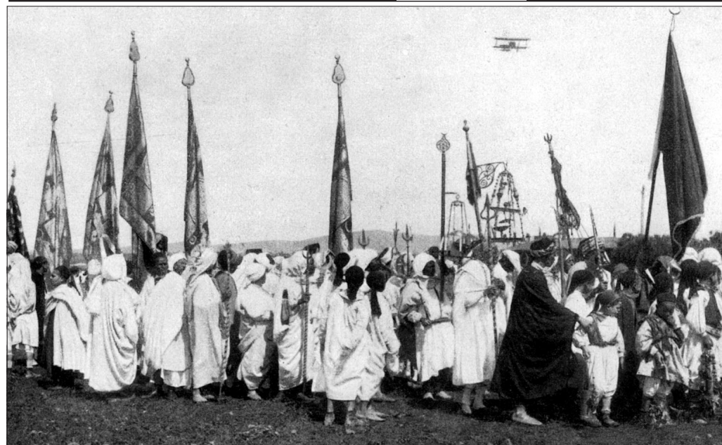
Umzug am Geburtstage des Propheten Mohammed (Milhud), Tunis. Banse, Abendland u. Morgenland , 1926, S. 273.

am Samstag, dem 17. Mai 2003, ab 17.30 Uhr, in der Osmanischen Herberge, Rinner Str. 15, 53925 Kall-Sötenich