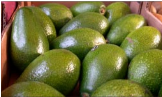
Wo nur in aller Welt gibt es diese herrlichen Avokados?

dort unter Schutz stehen. Man kann sie nicht anfassen. Es heißt: „Nichts hineinwerfen!“ Denn sie könnten zerstört, sie könnten verletzt werden. Diese Gedanken werden niemals über die Menschheit gehegt; sie machen alles, die ganze Menschheit, und fragen nicht danach, ob es Leuten schadet oder nicht. All diese Waffen – wozu? Kein Schaden für die Menschheit!?