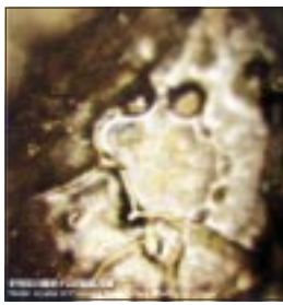
Wasserkristall vor dem Gebet

Der begeisterten Mannschaft, die voller Freude und Staunen „eine neue Welt“ entdeckt hat, sei Dank. ◆