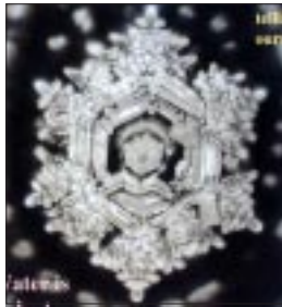
... und nach dem Gebet.