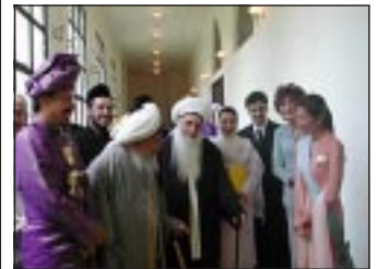
Eine der Hauptdarstellerinnen des Films (hier rechts: Michelle Yeoh) begrüßt Sheikh Nazim auf einer seiner Reisen.

Nachdem Li Mu Bai ermordet wurde, Jadefuchs tot ist und auch ihre Familie sie nicht mehr annehmen kann, bleibt nur noch das übrig, was konventionell unmöglich, ihrem Herzen aber entspricht. Sie trifft „Schwarze Wolke“ in den Bergen im Wutan-Kloster wieder. Er hatte ihr einmal eine traditionelle Geschichte erzählt, es heiße, wer den Mut habe, von diesem Berg zu springen, dem werde ein Wunsch erfüllt. Es werde Wirklichkeit, wenn man daran glaubt. So springt sie; sie schwebt aber so langsam hinunter – wer so über Dächer schweben kann, wie sie in diesem Film, dem glaubt man auch, daß er einen Berg hinunter „fliegen“ kann und unten heile ankommt.