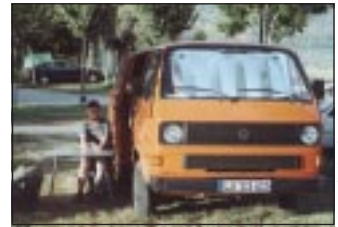
Auf dem Camping-Platz von Orjiva

Der Ferienzeit wegen ist die Berücksichtigung von Adressänderungen und sonstigen Wünschen bis einschließlich ca. Anfang August nicht möglich. Schöne Ferien wünschen wir Euch und uns!