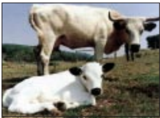
Seltenes englisches Parkrind.

Wir bitten dringend alle Regierungen, die gegenwärtig darum bemüht sind, die Verbreitung der Maul- und Klauenseuche zu verhindern, Schritte zu tun, daß die Schlachtung von Tieren eingeschränkt und nach anderen Mitteln gesucht wird, in humanerer Weise der Krise Herr zu werden. ♦