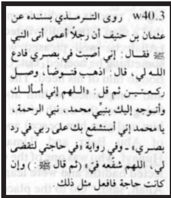
Das Hadith vom blinden Mann

nisten und Wahhabiten, diese oder jene Praxis der Sufis sei „ Bida “ (verwerfliche Neuerung) oder gar „ Schirk “ (Götzenverehrung, Beigesellung von Partnern neben Allah) wie Seifenblasen. So wird beispielsweise