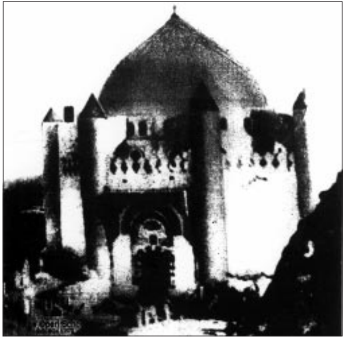
Maqam des Propheten Muḥammad ﷺ, zerstört am 7. Shawwal 1343 H. Ausschnitt aus dem Poster: The Site of Ahl ul-Bayt (A.) , The Open School Chicago.

Pilgerfahrt machen werde. O ihr Leute, Gott sagt: »O ihr Menschen, wahrlich, Wir haben euch geschaffen von einem Männlichen und einem Weiblichen und haben euch zu Völkern