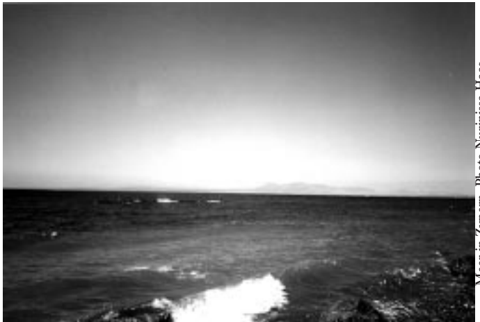
Meer in Zypern

zen. Und unser physisches Sein antwortet nie, was auch immer wir ersparen, als erstes sparen wir für uns. Sehr wenige oder einige Leute mögen sagen: „Ich spare nicht für mich auf, sondern für meine Kinder.“ Ja, einige Leute denken, sie seien viel cleverer als andere. Und sie sagen: „Wir sparen Materielles für unsere Kinder.“ – Warum versucht ihr, für eure Kinder aufzubewahren? Warum seid ihr nicht interessiert an euch selbst? Wenn ihr Zeit und die Gelegenheit habt, von Weltlichem für eure Kinder zu sparen, so wäre es statt dessen besser, an euch selbst zu denken. Darüber nachzudenken, was für euch selber besser wäre.