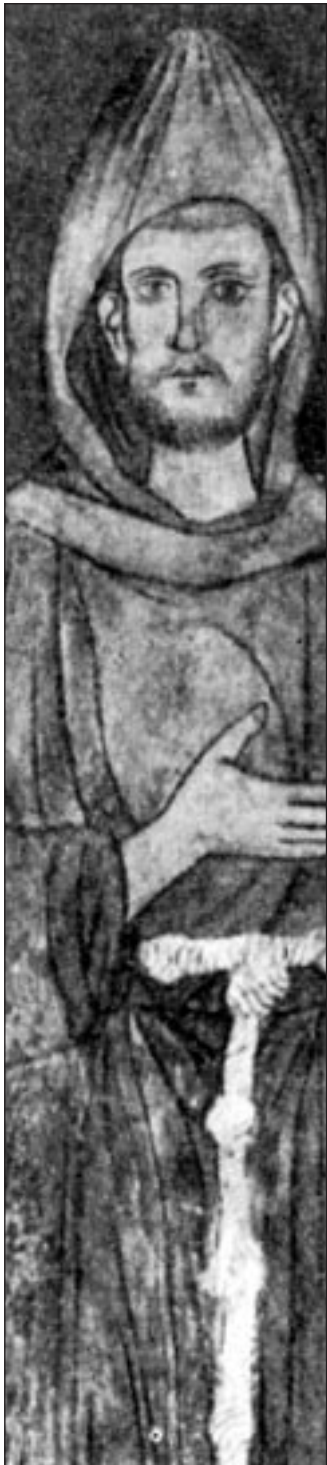
Bildnis des heiligen Franz von Assisi