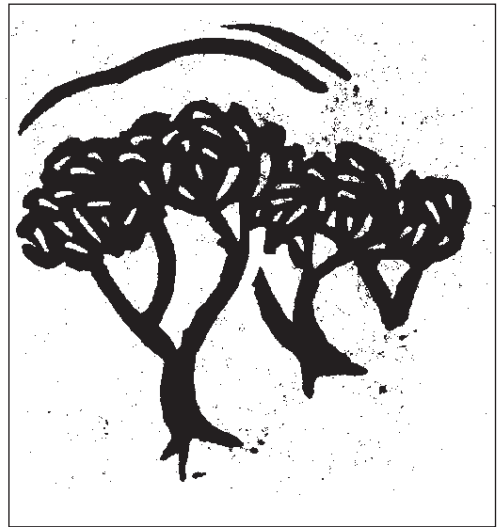
Linolschnitt Bernd Hagemann

vielleicht ist die Schönheit dieses Dinges auch so ein Schmetterling?“ Leise sprach der Heilige, wie zu sich selbst. Dann legte er die Puppenhülle und das Steinding dem toten Knaben auf die Brust: „Wir wollen alles Geformte der Erde wiedergeben, die Form muß immer wieder zerbrochen werden.“ Lauter sprach er: „Ich habe oft bei euch geruht, heute bin ich auf dem Weg zu meinem letzten Ruheort. So will ich euch ein letztes Wort der Ruhe geben, das mir auf der Verna gegeben wurde. Bedenkt's bis ihr's faßt. Die Armut nannte ich meine Braut und