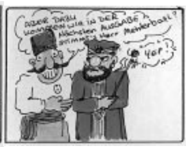
Vorläufiges Ende der Serie über die Eroberung Istanbuls von Yüsf Dıcıçi