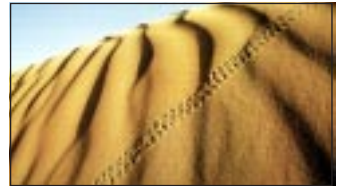
P. Boulat: Käferspur

„Wer in der ehrwürdigen Naqshbandi-Ṭarīqat Anordnung zum Khulwat (Rückzug) bekommen hat, wird dies vierzig Tage lang vom 1. Dhu l-Qa‘da bis zum 10. Dhu l-Hijja tun.“ Diese Zeit halte besondere Segnungen bereit, die dem Gottesfürchtigen Kraft geben, seine inneren und äußeren Feinde zu besiegen. Wer keine Zurückgezogenheit pflegt, kann die Absicht fassen, „Khulwat im Alltag“ zu tun. Hierbei bemüht man sich, vierzig Tage lang sein tägliches Adab at-Ṭarīqat und Wasifa zu machen sowie Ittikāf während der drei bestimmten Zeiten: zwischen Asr und Maghrib, zwischen Maghrib und ‘Isha und/oder im letzten Drittel der Nacht. ( Der Kalender der Osmanischen Herberge ) ◆