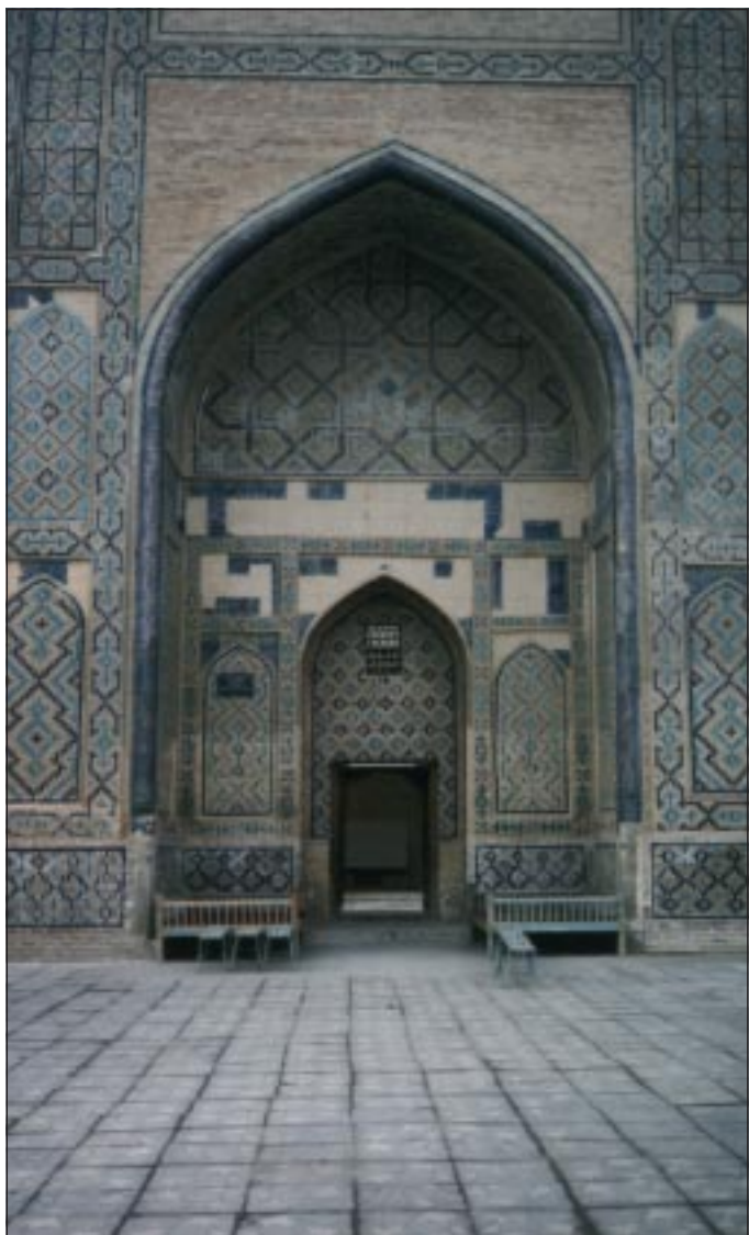
Blick auf den instandgesetzten Eingangsbereich zu ‘Abd al Khāliq al-Ghujduwānīs Medrese in Ghujduwān bei Bucharā. Vor dem Eingang stehen „Bänke“, sog. „Teabetten“ aus dem 16. Jahrhundert, auf denen man saß und eben Tee trank.

aus: P. de Vos: La Genèse de la Sagesse , Paris 1995.