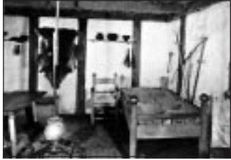
Bettecke im Gästehaus

Bauliche Anregungen für stromlose Zeiten: Fotos vom Germanengehöft (Freilichtmuseum in Oerlinghausen im Teutoburger Wald, das 1959/61 errichtet wurde).