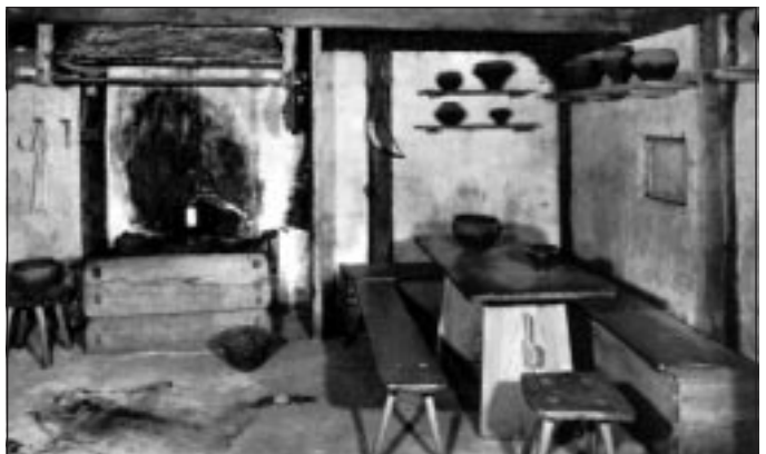
Tischecke und Herd im Haupthaus