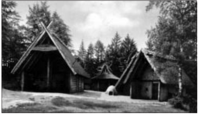
Gesamtansicht (germanisch-cheruskischer Bauernhof des 1. Jahrhunderts)