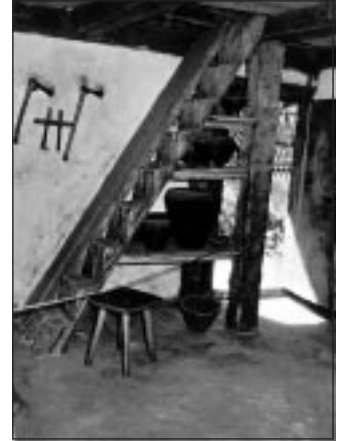
Treppe im Haupthaus