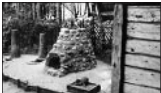
Eisen- u. Bronzschmelzofen