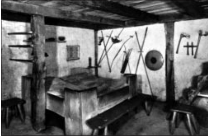
Bettecke im Haupthaus mit Treppenaufgang