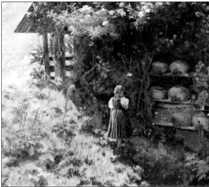
„Bei den Bienen“ von Curt Liebig (um 1896)

Weitere Heilanzeigen des Honigs: als Kräftigungsmittel, besonders für Kinder und alte Menschen, zum Verbinden schmieriger und infizierter Wunden, angeblich auch als Antidot (Neutralisierungsmittel) bei Pilzvergiftung, als Appetitzügler, indem man morgens als erstes einen Eßlöffel Honig isst, genauso wie zum Appetitanregen – beides abhängig vom Patienten –, Leberschwäche, Bluthochdruck und Förderung der Herzfähigkeit, infizierte Wunden, Geschwüre und Brandwunden,