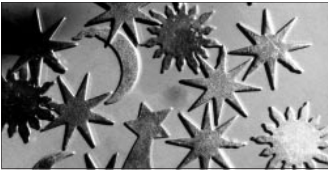
Gestaltung und Foto Antje Lauber