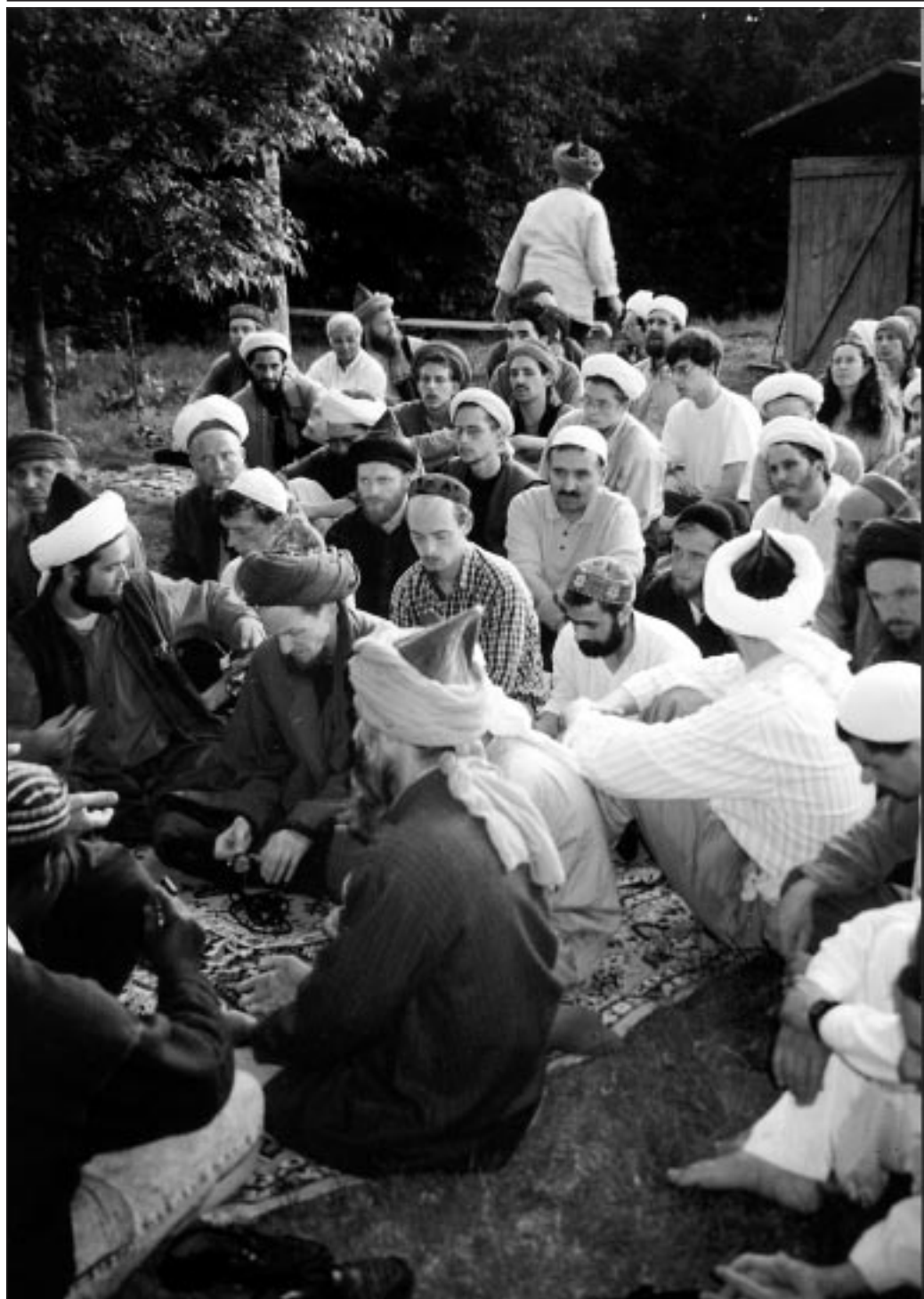
Ein Deutschlandtreff vor Jahren in Karlsruhe.