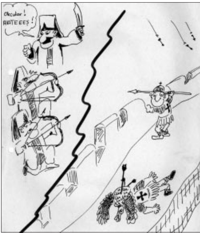
Cartoon aus der Reihe „Unsere Osmanen“ von Jusuf Dikici, Berlin

Ein Mönchsritter, der an vorderster Front gegen die Osmanen kämpfte, hat einmal geschrieben, daß die Osmanen so viele Pfeile abgeschossen, daß die Fläche, die die Pfeile überflogen, vollkommen verdunkelt wurde. Die Sonne schien erst wieder durch, als die Pfeile vorüber waren. ♦