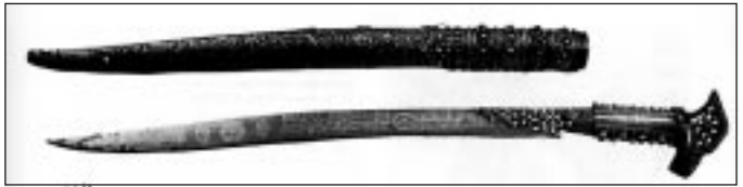
Jatagan: Türkei, 1798. Material: Eisen, Silber, Koralle, Länge: 71,5 cm.

Eine für den Balkan und die Türkei in gleicher Weise charakteristische Hieb-Waffe ist der Jatagan, der im Gürtel getragen wurde. In Europa oft irrtümlich als „Handschar“ bezeichnet, ist seine Klinge einschneidig, etwa 60 cm lang, konkav gebogen und so ausgeschliffen, daß die Klinge zur Spitze hin ihre größte Breite erreicht. Damit wird dem Hieb mit dieser Waffe eine große Wucht verliehen. Der Jatagan war noch in den zwanziger Jahren unseres Jahrhunderts als Waffe des freien Gebirgsbewohners auf der Balkanhalbinsel in Gebrauch. Es sind viele Beispiele erhalten, die ebenso wie der Säbel auf der Klinge Verse aus dem Koran und dem Hadith, Meister- und Besitzernamen sowie ein Datum tragen. Der typische Griff des Jatagan kann aus