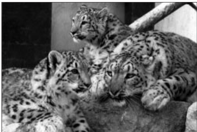
SCHNEELEFPARDEN, FOTO: JÖRG HESS